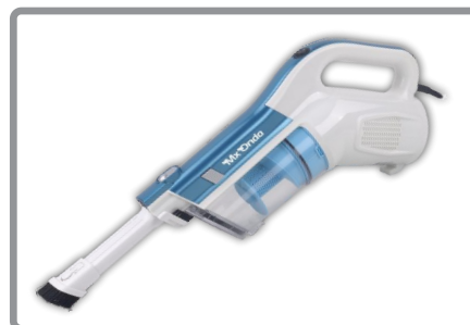
Aspirador de mano