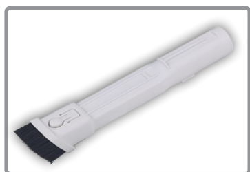
Boquilla doble (fina+cepillo)