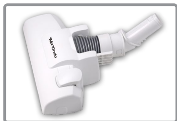
Cepillo con dos posiciones (suelo y moqueta/alfombra)