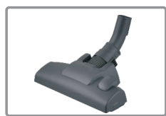
Cepillo con dos posiciones (suelo y moqueta/alfombra)