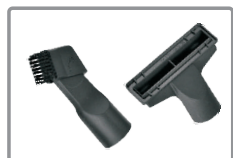
Boquilla doble (fina+cepillo) y boquilla para tapicerías