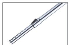
Tubo telescópico de metal