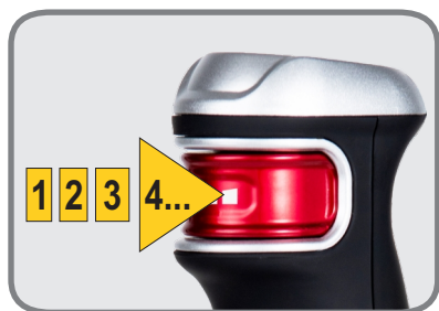
Control electrónico de velocidad por presión